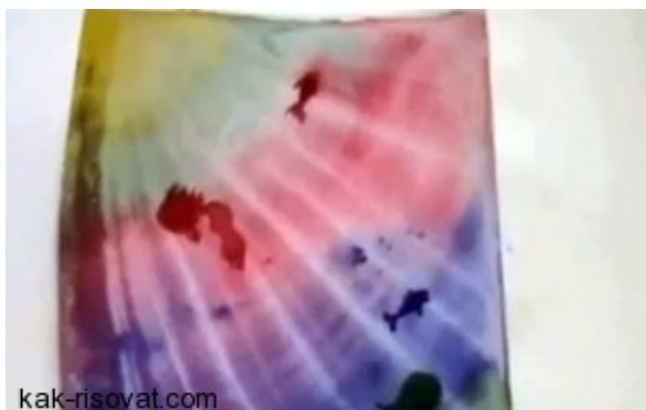
Уроки рисования. Монотипия